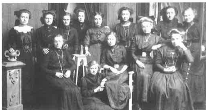
Interne kweekschoolleerlingen bij de zusters van de Choorstraat, 1913. Van deze groep traden vijf meisjes bij de congregatie in.

De derde fase in de ontwikkeling van beide zustercongregaties, vanaf de eeuwwisseling tot rond 1940, staat in het teken van institutionalisering, uniformering en verdere verfijning van de regelgeving. De marges voor invulling van het religieuze leven naar eigen inzicht werden zeer klein. Het innerlijke geloofsleven kon daaraan echter nog steeds ontsnappen. In deze periode dijdten de werkzaamheden enorm uit en werden zelfs nieuwe werkterreinen betreden, onder meer buiten Nederland. Daar lagen voor de zuster mogelijkheden voor eigen inbreng en initiatief. In deze derde fase vereisten de werkzaamheden professionalisering en specialisering. Steeds meer zusters werden opgeleid voor het onderwijs en de verpleging en/of specialiseerden zich in een bepaalde soort verpleegkundige zorg of onderwijs. De mogelijkheden tot ontwikkeling van eigen talenten, van kennis en kunde namen daardoor toe.