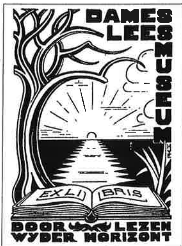
Het Ex Libris van het Damesleesmuseum werd in 1934 door Hein von Essen ontworpen.

Bij de oprichting van het Damesleesmuseum in 1884 werd bewust gekozen voor het woord 'dame' in de titel: het was, zo vond men, immers veel toepasselijker dan 'vrouwen'. Dames waren verfijnde en beschaafde vrouwen. Een aantal van hen was gelukkig in een leven vol mondaine pretjes, maar sommigen verlangden naar ontwikkeling en cultuur. Het was buitengewoon ongelukkig dat de bestaande leesgezelschappen geen toegang boden aan vrouwen, anders dan als echtgenote van of dochter van. Openbare bibliotheken waren er toen nog niet. De oplossing was even eenvoudig als gewaagd: er zou een eigen bibliotheek voor dames moeten komen, waar men in alle rust boeken en tijdschriften kon raadplegen en lenen.