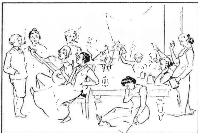
Kroegjool op de Kattenkroeg Spotprent op een club van vrouwelijke studenten Naar een tekening in Propria Cures , jaargang XIII (1903) blz. 333

Door alle polemieken die verschenen over de 'vrouwenstudie' hadden de studentes een dubbele taak gekregen: naast het behalen van uitmuntende studieresultaten dienden zij hun vrouwelijkheid te bewijzen. "Wij meisjesstudenten waren dan ook in die eerste jaren diep doordrongen van het besef, dat wij het bestaansrecht van de studerende vrouw hadden waar te maken. Onze studie had, naast de intellectuele, een morele en culturele basis." 11 De verenigingen dienden als vertegenwoordigers van de vrouwelijke studenten hun bestaansrecht waar te maken. Dit betekende dat de verenigingen een gepaste middenweg moesten zoeken tussen studie en 'vro(uwe)lijkheid'. In de eerste jaren werden de verenigingen gevormd als studiedisputen en 'debating societies': dit betekende dat de leden lezingen hielden en stellingen verdedigden. De Vereeniging voor Vrouwelijke studenten te Leiden (V.V.S.L.) begon in 1900 als een leesgezelschap; de bedoeling was dat leden boeken kwamen lenen en bespreken. De nadruk werd echter teveel gelegd op de intellectuele ontwikkeling van de leden, die nu juist op zoek waren naar onderlinge gezelligheid. Boeken werden niet geleend en vergaderingen werden niet bezocht.