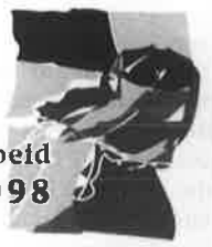
Vrouw en Arbeid 1898 - 1998

Zevenennegentig jaar geleden vond een zeer bijzondere manifestatie plaats: de Nationale Tentoonstelling Vrouwenarbeid. Door arbeid van vrouwen in de schijnwerpers te zetten trok de tentoonstelling wekenlang de aandacht van het publiek en de pers. Duizenden bezoekers gingen naar Den Haag om de tentoonstelling te bezichtigen. De tentoonstelling was zo baanbrekend, dat de Stichting Vrouw en Arbeid 1898-1998 over drie jaar een eeuwfeest wil geven.