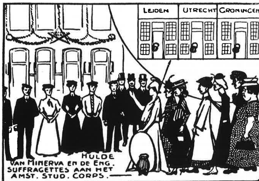
Spotprent op de toelating van vrouwelijke studenten in het Amsterdamsch Studenten Corps in 1903 Naar een tekening, in het bezit van Mevrouw H. Brouwer-Fromman te Amsterdam

Het belangrijkste ritueel, maar tevens meest problematische, was 'het novitiaat': de groentijd. Uit het archief van de V.V.S.L. blijkt dat de instelling van het novitiaat met veel discussies gepaard ging. Door de groei van het aantal leden vonden de vrouwen dat de vereniging de contacten tussen de eerstejaars onderling en met oudere leden verbeteren moesten. Er moest een formele kennismaking ingesteld worden. Maar de angst was groot dat de vereniging, door de instelling van een groentijd, op het corps zou gaan lijken. De ontgroeningen binnen het corps, als introductie in het mannenleven, gingen nogal eens gepaard met ongeregelde heden en het werd ongewenst geacht om op dergelijke wijze aandacht te trekken. Dus geen eis tot gehoorzaamheid, alleen een verplichte kennismaking: "alles even gezellig, alles ter veraangenaming van het